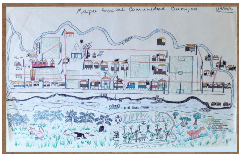
| Figura 3 - Mapa cartografía social. Comunidad indígena-originaria de Burujón.

También cuenta con un espacio para primera infancia donado por Instituto Colombiano de Bienestar Familiar ICBF, el cual cuenta con panel solar, nevera, baños, manejo de agua lluvia y tanque de almacenamiento. La comunidad está rodeada por una quebrada, así mismo, la comunidad a partir del Colegio tiene una parcela demostrativa la cual consta de una hectárea, donde se tiene sembrado, plátano, banano, papa-china, Lulo y yuca. La comunidad está asentada al lado del departamento del Chocó, parte de sus parcelas, zonas de cacería y aprovechamiento forestal están al lado del departamento del Valle del Cauca. En la actualidad existen tres tiendas de orden comunitario.(Figura 3).