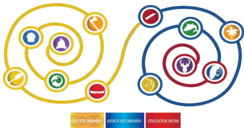
| Figura 4 - Gráfica de espiral para el tejido de saberes Jooin Gayam.